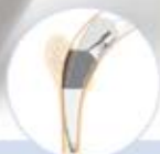
Verkürzter, gebogener Schaft für primäre Hüft-TEP