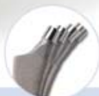
Unterschiedliche mediale Krümmungen für eine präzisere Rekonstruktion der Patientenanatomie