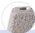
Porolock® Ti-Plasma- beschichtung für eine verbesserte Osseointegration

Innovation, die bewegt. Zimmer ist ein weltweit führender Anbieter von orthopädischen Produkten für die Bereiche Rekonstruktion, Wirbelsäule und Traumatologie sowie von Dentalimplantaten und zugehörigen orthopädisch-chirurgischen Produkten. Zimmer betreibt Niederlassungen in mehr als 25 Ländern auf der ganzen Welt und verkauft Produkte in über 100 Ländern. Unsere Mission ist die Entwicklung, die Herstellung und der weltweite Verkauf der hochwertigsten orthopädischen Produkte, die reparieren, ersetzen und rekonstruieren. Dabei können wir auf das Engagement unserer mehr als 7.500 Mitarbeiterinnen und Mitarbeiter auf der ganzen Welt zählen.